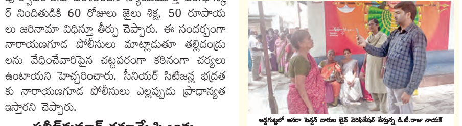
ఇండ్ల వద్దకే ఆసరా పెన్షనరీదారుల లైన్ వెలికితీసే : తహసీల్దార్